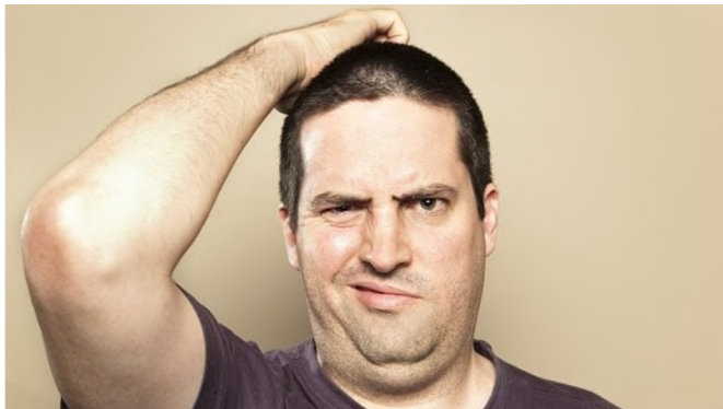
Ilustrační obrázek

Pokud je člověk bez práce v evidenci uchazečů o zaměstnání na úřadu práce, má povinnosti, které musí plnit. Při jejich porušení hrozí, že bude z evidence vyřazen.